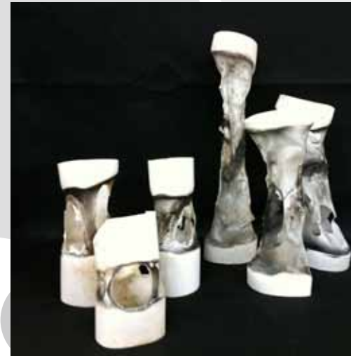
Crebas de plástico