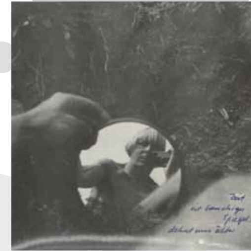
Fotografía do "Museum vom Einsiedler Man."